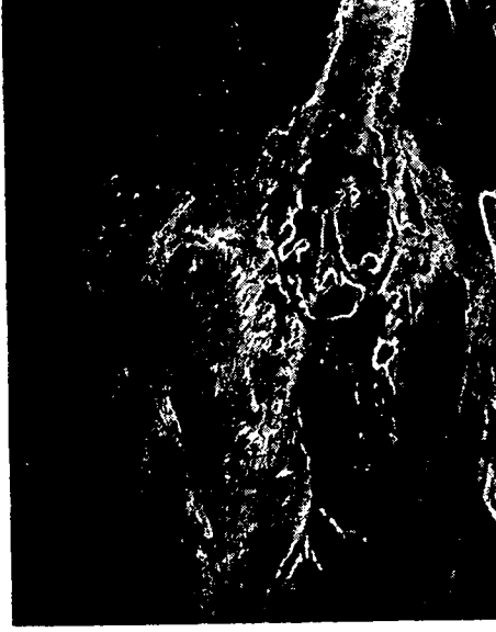
Tedaviden önce (Before treatment)

Vak'a : 4 (Case: 4) Prot.: 1253 (Port.: 1253) Prolapsus Recti (Prolapse of the Rectum)