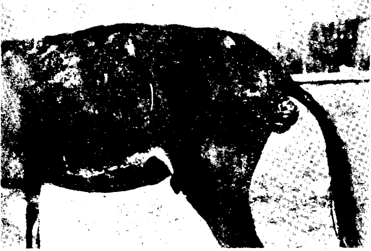
Tedaviden önce (Before treatment)

Vak'a : 6 (Case 6) Prot.: 1996 (Port.: 1996) Prolapsus Recti Prolapse of the Rectum)