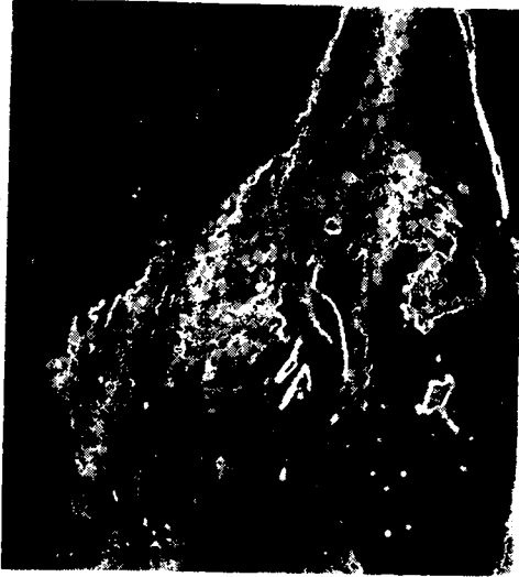
Tedaviden sonra (After treatment)