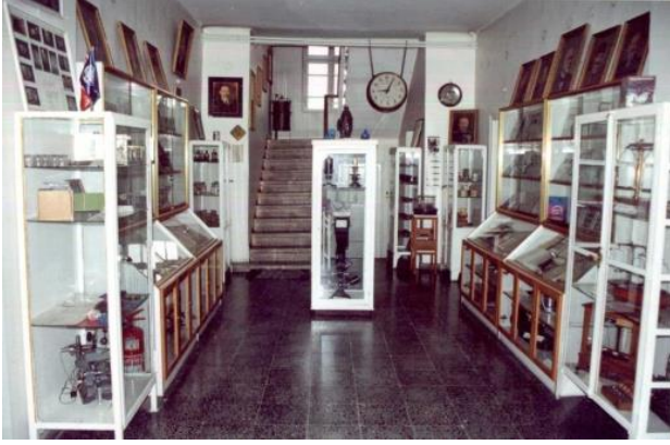
Şekil 6. Veteriner Tarihi Müzesi Tarihi Binasında (1990) Figure 6. Veterinary History Museum in its Historical Building (1990)

Veteriner Tarihi Müzesi Çalışmaları Projesinin “veteriner hekimliği alanında tarihi değer taşıyan eski kitapların satın alınması, fotokopi ve mikrofilmlerin temini ve veteriner hekimliği tarihini ilgilendiren şahsiyetlerin resim veya portrelerinin yaptırılması” olmak üzere üç başlık altında yürütülmesi planlanmıştır; öncelik son maddeye verilmiştir. 7 Bu amaçla veteriner hekimliği tarihinde önemli yer tutan Türk ve yabancı isimler belirlenmiş ve İstanbul’da yaşayan Ressam Murtaza Elker’e bu isimlerin 13 adet yağlı boya portresi hazırlanmıştır. 8 Portrelerin sanatsal değerlerinin tespiti, Ankara Üniversitesi Tıp Fakültesi Tıp Tarihi Enstitüsü ve Etnografya Müzesi uzmanlarından oluşan bir jüri tarafından gerçekleştirilmiştir. 9 Yine Müze Projesi kapsamında Ankara’da bir fotoğraf stüdyosuna 11 adet siyah-beyaz fotoğraf hazırlanmıştır; bu arada Türk Veteriner Hekimleri Biyografyası projesi uyarınca ilgili kurum ve kişilerden biyografik bilgilerin toplanmasına devam edilmiş; ayrıca İstanbul ve Ankara’da bulunan çeşitli sahaf, kitapçı ve koleksiyonerlerle iletişime geçilerek tarihi nitelikli bazı yazma eserler satın alınmıştır. 10 Ancak, ‘eski belge ve kitapların temininin rastlantılara bağlı olması’ gerekçe gösterilerek bu son girişim 1971 yılında sonlandırılmıştır. 11 Diğer yan-