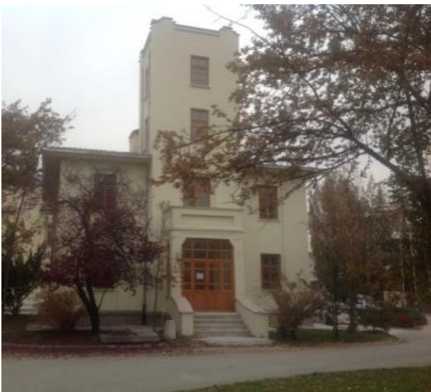
Şekil 7.a.b.c. Veteriner Tarihi Müzesi'nin Tarihi Binası (1933?, 1970? ve 2014)

Figure 7.a.b.c. The Historical Building of the Veterinary History Museum (1933?, 1970? and 2014)