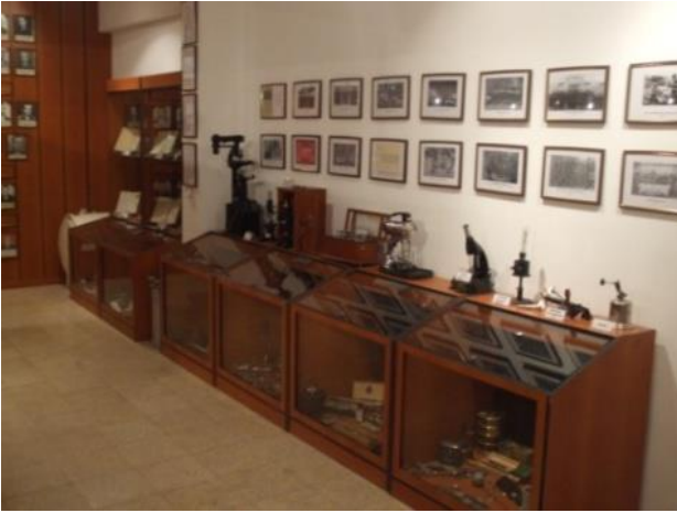
Şekil 3. Askeri Veteriner Hekimlik Tarihi Müzesi (2011) Figure 3. Military Veterinary History Museum (2011)