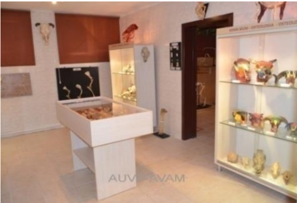
Şekil 5. Veteriner Anatomi Sergi Salonu (2013) Şekil 5. Veterinary Anatomy Gallery (2013)