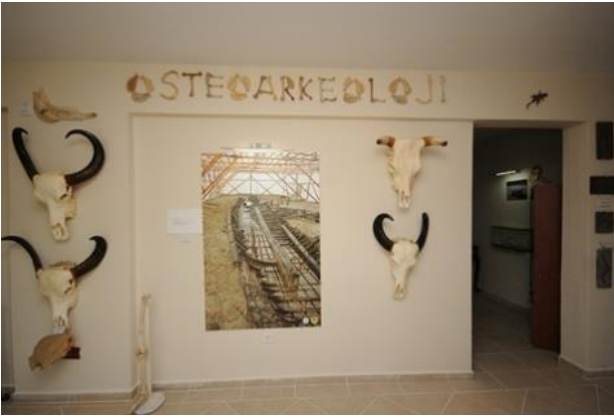
Şekil 4. Osteoarkeoloji Araştırma ve Uygulama Merkezi (2013) Figure 4. Osteoarchaeology Research and Practice Centre (2013)