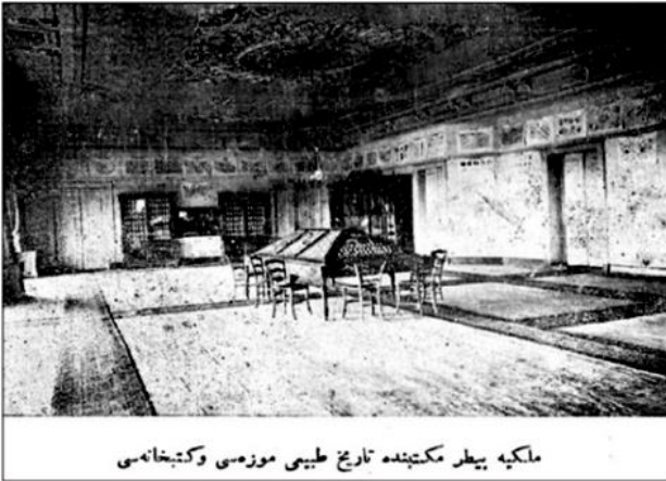
Şekil 1. Mülkiye Baytar Mektebi Târih-i Tabii Müzesi ve Kitâbhânesi (?)

Türkiye'de veteriner hekimliği alanında saptanabilen ilk müzenin, 1889 yılında eğitim-öğretime başlayan Sivil Veteriner Okulu'nda " Doğa Tarihi Müzesi " (Şekil 1) (21, 32, 35) adıyla kurulduğu görülmektedir. Bu girişimi izleyen yıllarda, ne Askeri Veteriner Okulu'nda ne Sivil Veteriner Okulu'nda ne de 1921 yılında iki okulun birleştirilmesiyle oluşan Yüksek Veteriner Okulu'nda kayıtlara geçen bir müzecilik faaliyetine rastlanmamıştır.