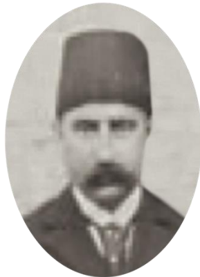
Şekil 1. Ahmed Abdullah Bey Figure 1. Ahmed Abdullah Bey

“Birinci madde: Bir öğrencinin Avrupa’ya gönderilmesi gerektiğinde, o öğrencinin öğrenim geçmişi bağlı bulunduğu kurum tarafından göz önüne alınacaktır. Bu nedenle, siyasi bilimler ve hukuk için Mülkiye ve Hukuk Mektepleri, tıp bilimleri için Mülkiye Tıp Mektebi, diğer alanlar için devlet tarafından uygun görülen okullardan mezun kişiler seçilecektir.