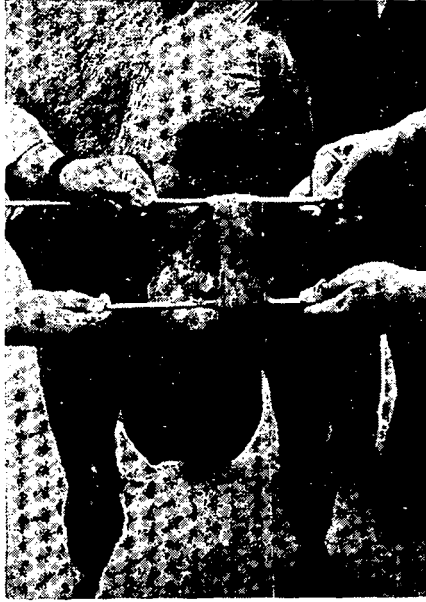
Resim: 1. Et band'ın arkadan görünüşü. Fig.: 1. Back view of the caudal band.